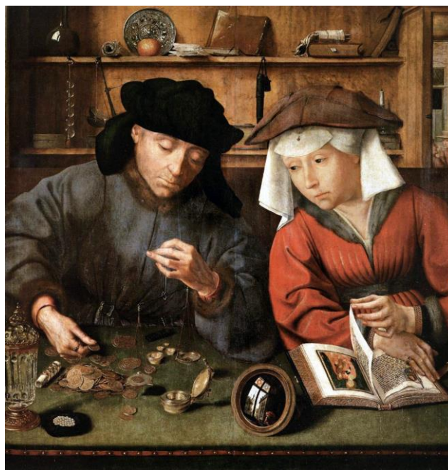
Quentin Metsys, Le Prêteur et sa Femme , 1514. Paris, Musée du Louvre.

Direzione Amministrativa Sezione Finanza e Controllo