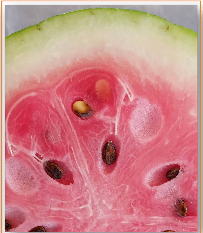
Particolare del frutto maturo

CARATTERISTICHE VARIETÀ: nella Collezione Polvese questa antica varietà è stata donata nel 1996 da un agricoltore di Castiglione del Lago. Nel 2023 l'Università degli Studi di Perugia l'ha rinnovata in isolamento. Oggi è disponibile alla coltivazione in diversi comuni lacustri.