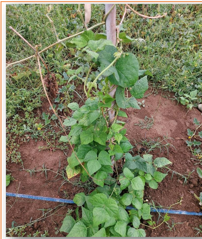
Pianta giovane su supporto