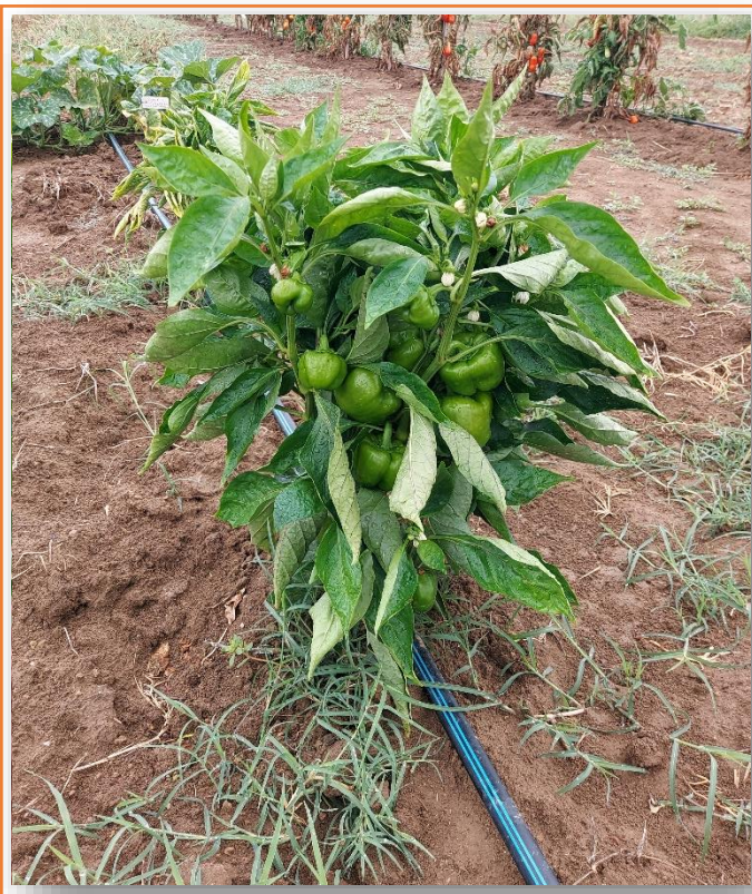
Pianta con portamento cespuglioso