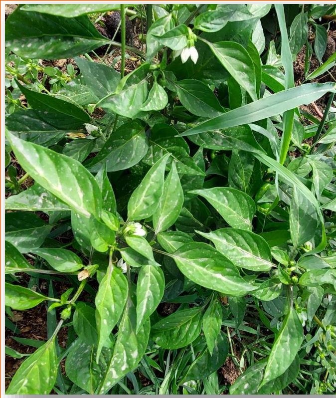
Pianta giovane. Si evidenzia la forma delle foglie e dei fiori