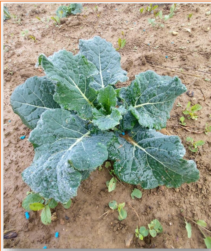
Pianta giovane con foglie coriacee verdi-scuro